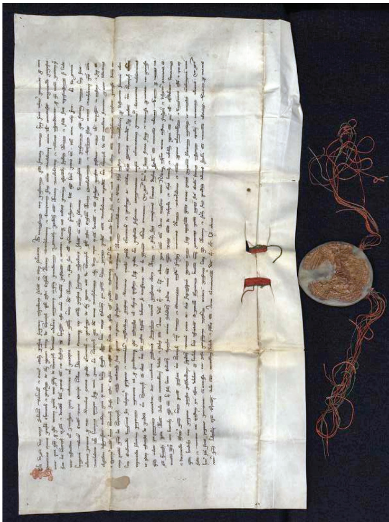
Obr. 3. Konfirmácia udelenia dediny Gostović v Chorvátsku Abrahámovi a jeho bratom vykonaná chorvátsko-slavónskym vojvodom Belom, 1268.