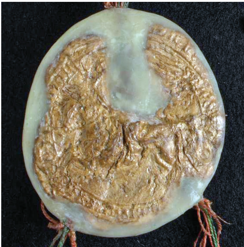
Obr. 4. Fragment pečate chorvátsko-slavónskeho vojvodu Bela, 1268.