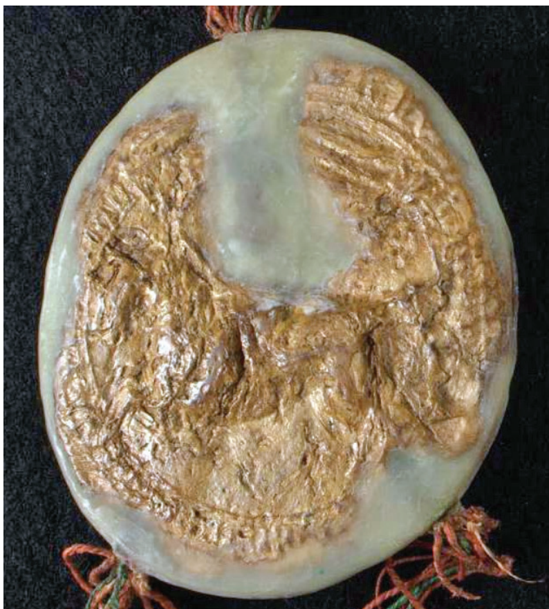
Obr. 5. Fragment pečate chorvátsko-slavónskeho vojvodu Bela, 1268.