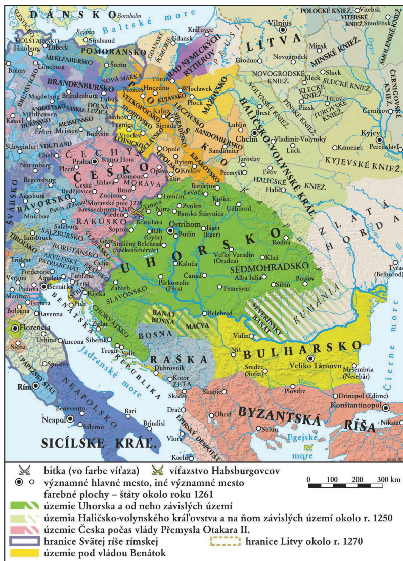
Mapa č. 2: STREDNÁ EURÓPA A BALKÁN V DRUHEJ POLOVICI 13. STOROČIA