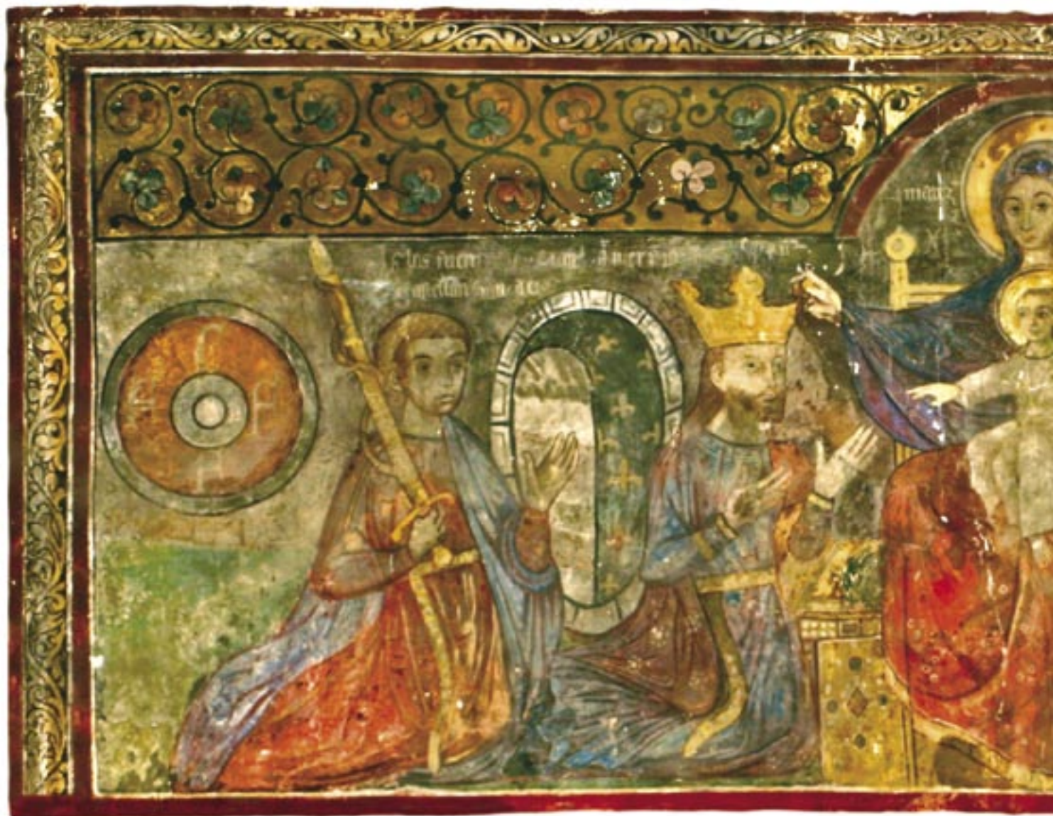
Nástenná maľba Korunovanie Karola Róberta Pannou Máriou (rok 1317). Technika: kombinovaná, secco-fresco. Rozmer: 473x185 cm.